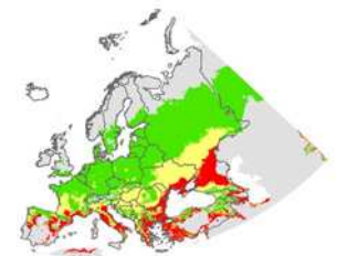
Abb. 3: Modellierte Arealverschiebung durch den Klimawandel